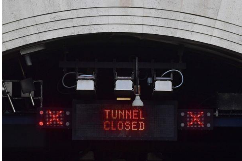
Figure 1: fermeture du tunnel

Le résultat final dans les deux cas est un tunnel fermé. Pendant les heures de pointe, l'indisponibilité du tunnel peut entraîner d'importantes embouteillages, laissant les conducteurs bloqués pendant ce qui peut devenir même des heures dans le pire des cas. Cela pourrait également signifier que les services d'urgence devront utiliser une autre route pour aller d'une partie de la ville à l'autre et perdre un temps précieux.